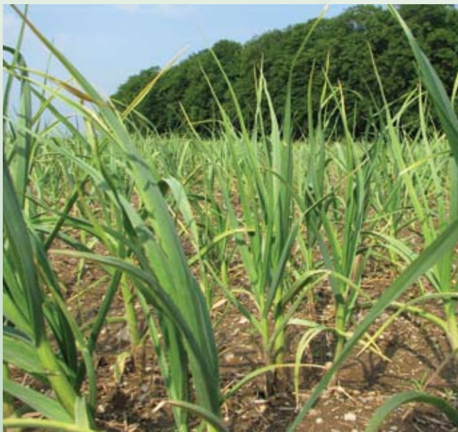
Česen na isto površino sadimo po štirih letih

Česen sadimo ročno ali strojno. Sadimo ga na razdaljo 25-40 cm med vrstami in na 8-10 cm v vrsti (jesenskega lahko na razdaljo 10-15 cm v vrsti) ter na globino 7-10 cm (spomladi nekoliko plitveje). Pomembno je, da so stročki postavljeni pokonci. Potrebujemo od 500-1000 kg stročkov/ha. Višji pridelek dajo zunanji stročki, zato je smiselno ločevati notranje in zunanje stroke (zunanji so večji). Ker česen ne prenaša zastajanja vode, prav tako pa zahteva do konca rastne dobe čim bolj rahlo zemljo, se priporoča sajenje česna na gredice.