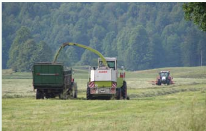
Storitve s kmetijsko mehanizacijo je možno opravljati kot dopolnilno dejavnost na kmetiji.