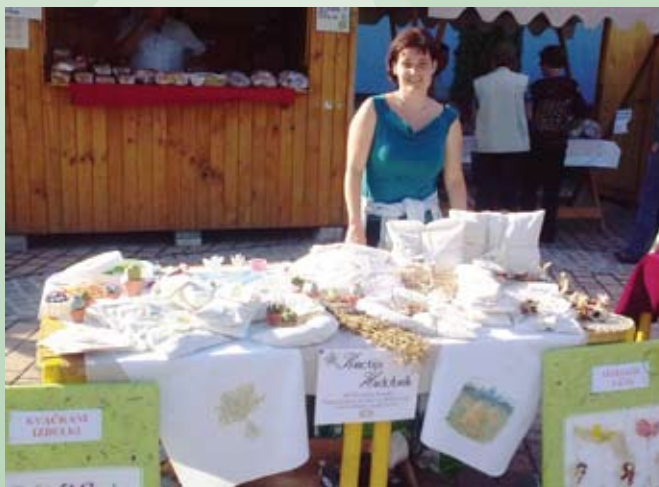
Z dopolnilno dejavnostjo je možno zasesti novo tržno nišo.