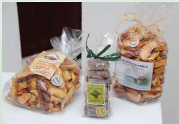
Veliko dopolnilnih dejavnosti se nanaša na predelavo kmetijskih pridelkov.