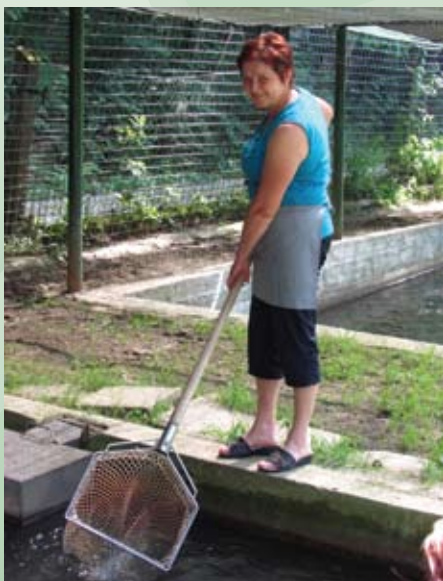
Ribogojstvo je ena od možnosti dodatnega zaslužka na kmetiji.

Količinske omejitve v dopolnilnih dejavnostih določa Uredbe o vrsti, obsegu in pogojih za opravljanje dopolnilnih dejavnosti na kmetiji (Ur.list št.61/05).