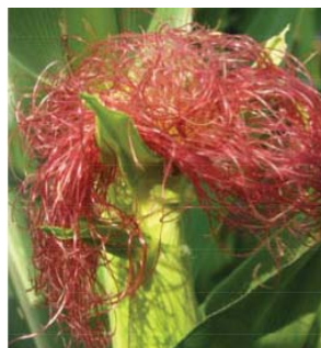
Slika 1: Svilanje koruze

Koruza je poljščina, ki potrebuje za optimalni razvoj precej vode. Za pridelek 10 ton zrnja na hektar porabi koruza najmanj 7.000 ton vode (700 l/m 2 ), pri čemer nista upoštevani izhlapevanje in odcedna voda.